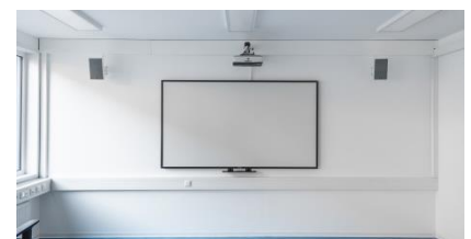
interaktives Whiteboard Schulung