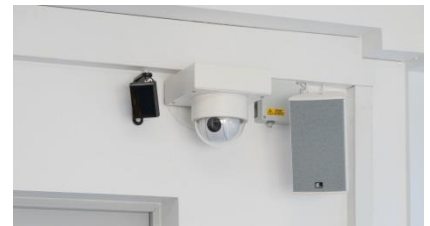
Überwachung und Durchrufanlage