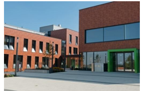
Büro- und Verwaltungsgebäude – Haus 3