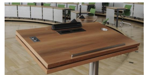
Rednerpult mit Mikrofonarray