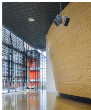
Vorraum des Plenarsaales