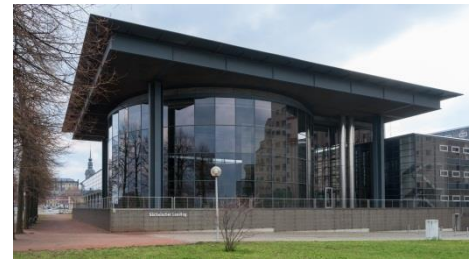
Plenarsaalgebäude „Sächsischer Landtag“