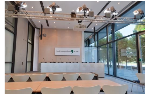
Saal 1 - Pressekonferenzsaal