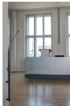
Mikrofonanordnung mit aktiver Schallzeile