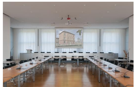
Fraktionssitzungssaal A 600